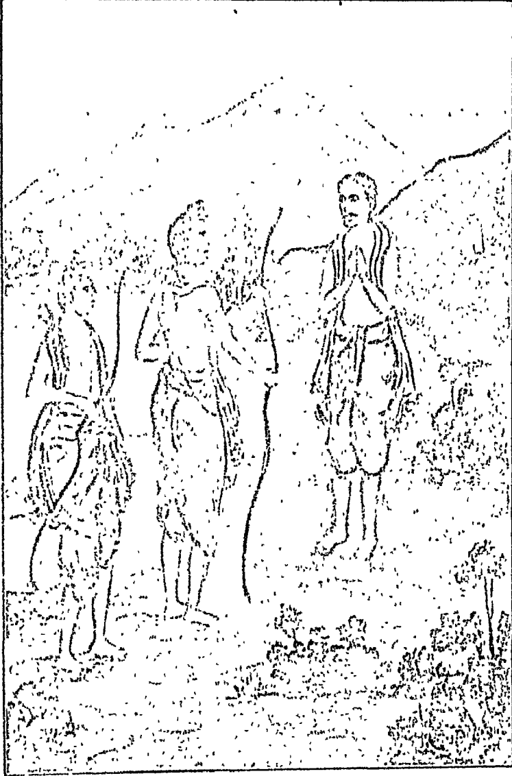
श्रीराम लक्ष्मण और वदरूपधारी हनुमान